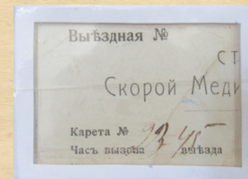
Пропуск на выезд кареты