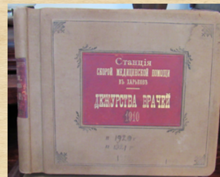
Книга учета дежурства врачей ССМП