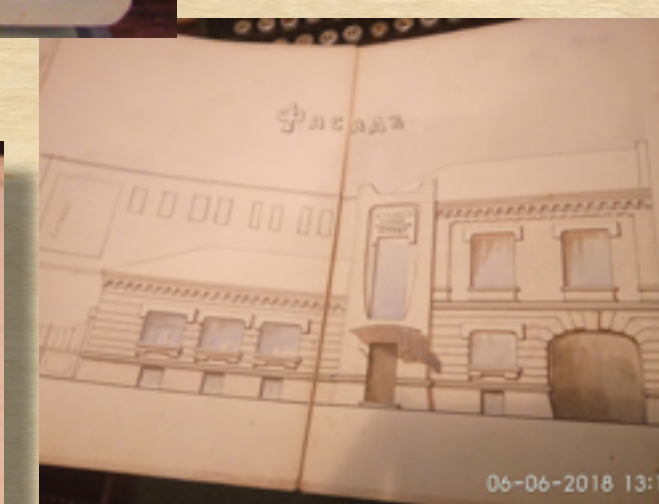
Оригинал проекта здания ССМП, архитектор В.Е. Мороховец, 1910