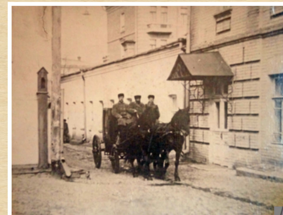
Выезд кареты Скорой помощи