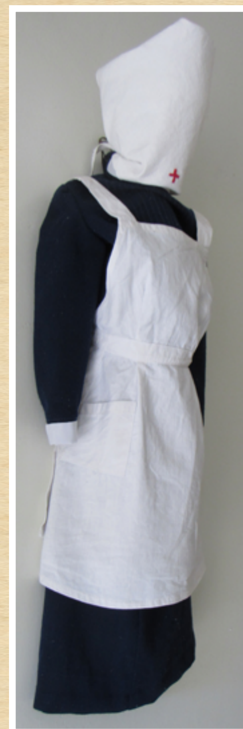
Макет одежды работницы ССМП

В 1919 году общество Скорой медицинской помощи было национализировано.